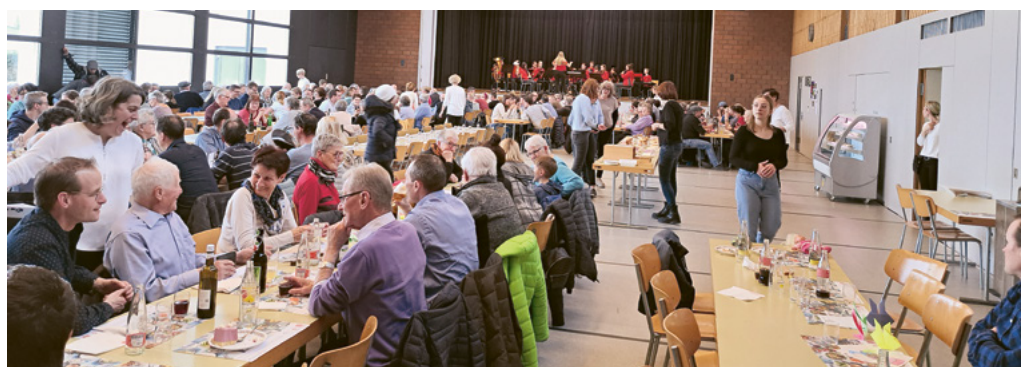
Gut besuchter Suppentag vom 12. März in der Mehrzweckhalle.