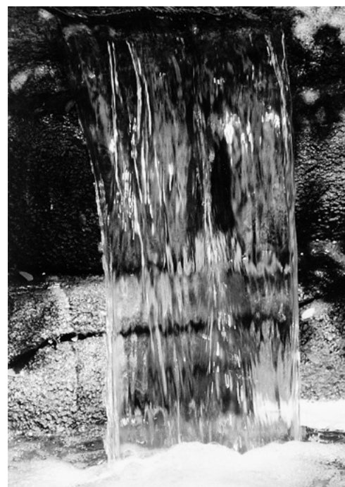
Antoine de Saint-Exupéry, Wind, Sand und Sterne, © Karl Rauch Verlag, Düsseldorf

Du duldest nicht jede Veränderung. Aber du schenkst uns ein unbeschreibliches einfaches und grosses Glück.»