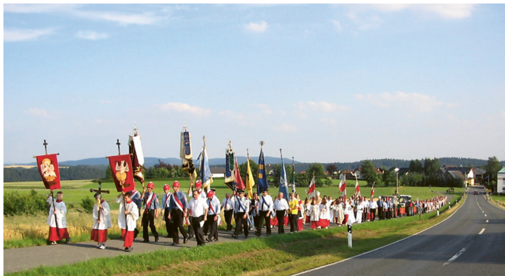
Eine Bittprozession in Unterfranken, Süddeutschland, um Christi Himmelfahrt.